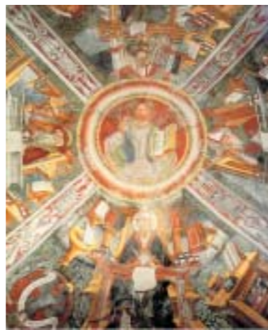
Info: APT Terme di Comano - Dolomiti di Brenta (Tel. 0465 702626)

Durante il periodo estivo vengono organizzate visite guidate alle chiese affrescate, tra le quali un vero e proprio itinerario dedicato ai pittori Baschenis.