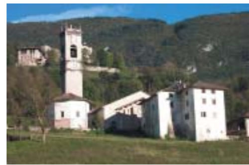
Info: APT Terme di Comano - Dolomiti di Brenta (Tel. 0465 702626) APT Garda Trentino (Tel. 0464 554444) Associazione pro Ecomuseo (Tel. 339 3311803)

Molte ancora le chiesette di montagna come quella di San Pietro nel Tennesse, o le cappelle sparse per il territorio, in ognuna delle quali si può trovare l'atmosfera raccolta dei luoghi sacri e si può scoprire la lunga storia che le contraddistingue.