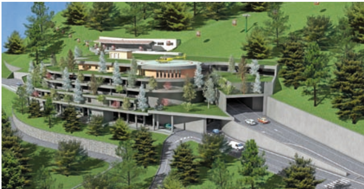
Riqualificazione del Colarin - simulazione realizzata al computer

sede di attività di protezione civile e di ambulatorio ortopedico. Si impegna inoltre a concorrere alla progettazione di un sistema di gestione innovativa del traffico veicolare, che preveda una rete di mobilità pubblica interna a Madonna di Campiglio, la mobilità dai parcheggi di Campo Carlo Magno, Colarin, Tulot e Carisolo verso Sant'Antonio di Mavignola e Madonna di Campiglio, nonché sistemi di comunicazione (l'ultima fase del progetto prevede la realizzazione di un collegamento funiviario da Sant'Antonio di Mavi-