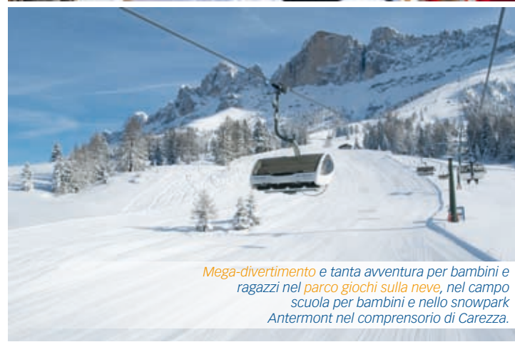
Mega-divertimento e tanta avventura per bambini e ragazzi nel parco giochi sulla neve, nel campo scuola per bambini e nello snowpark Antermont nel comprensorio di Carezza.

20 minutes north of Bozen in the sunny South Tyrol skiing region, with 16 lift systems, 40 km of slopes and a fantastic view of the Dolomites in King Laurin's realm, Rosengarten and Latemar. From December 2008, there will be 3 new lift systems, new skiing slopes and 170 snow cannons to guarantee snow from December to April in the awe-inspiring Carezza skiing region of the Dolomites.